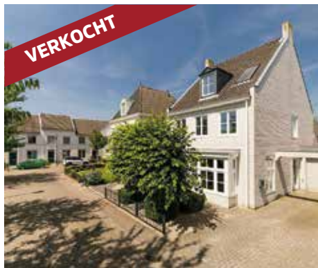
Moerdonkvoort 21 5706 HL Helmond vraagprijs € 424.000 k.k.