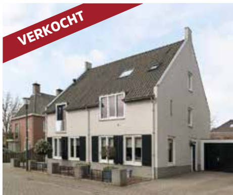
den Hoge Hurk 16 5706 SK Helmond vraagprijs € 400.000 k.k.