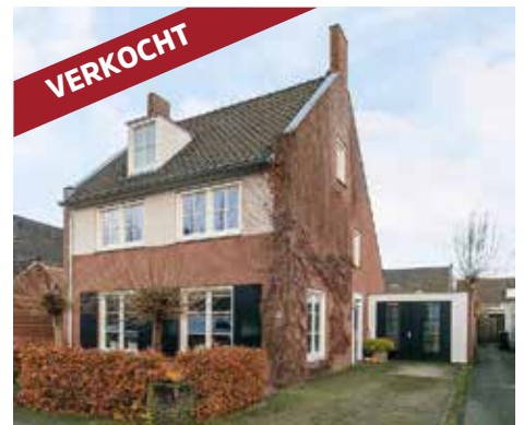
Melvert 6 5706 KV Helmond vraagprijs € 525.000 k.k.