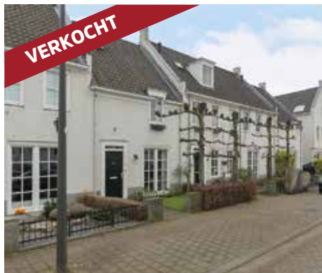
Biesveldje 15 5706 KT Helmond vraagprijs € 299.000 k.k.