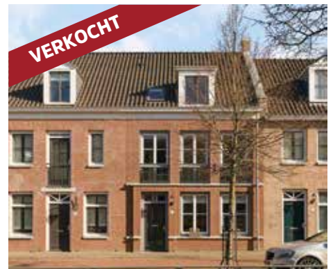
Middellaan 44 5708 ZE Helmond vraagprijs € 300.000 k.k.