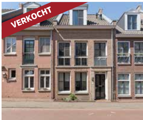
Smidsteeg 11 5708 XL Helmond vraagprijs € 275.000 k.k.